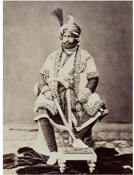
Maharajah Ranbir Singh von Jammu und Kaschmir (1857 bis 1885)