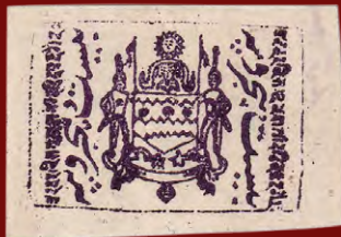
Von dem Spitzenwert 25 Rupien violett aus dem Telegrafemarken-Satz von Jammu und Kaschmir (1884) existieren nur zwei Exemplare.

Freuen Sie sich auf die Herbstauktion bei Heinrich Köhler. Denn dann kommen einige der seltensten Marken und Frankaturen indischer Feudalstaaten zum Ausruf. Eine kleine Kostprobe für Liebhaber des Besonderen geben die Stücke, die Sie hier sehen.