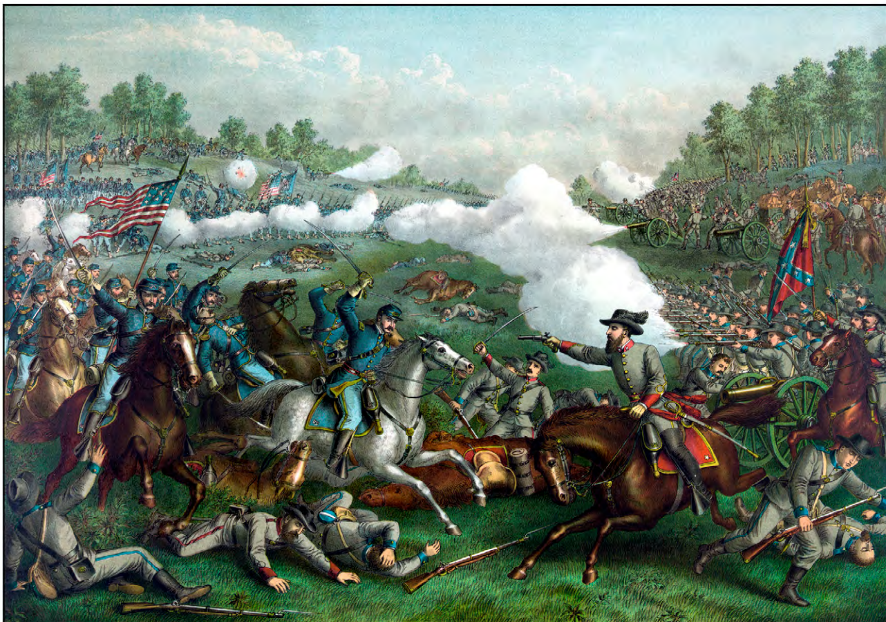
Die dritte Schlacht von Winchester vom 19. September 1864 gilt als eine der blutigsten und wichtigsten Auseinandersetzungen zwischen dem Norden und dem Süden, aus der die Union schließlich als Sieger hervorging.

extrem konservativ. Der Norden war industriell geprägt. Im Süden herrschte eine vermögende Pflanzaristokratie, die die Sklaverei als Teil ihres Lebensstils betrachtete und bewahren wollte. Nicht zuletzt konnten sie ihre riesigen Baumwollplantagen nur mithilfe der Sklaven gewinnbringend betreiben.