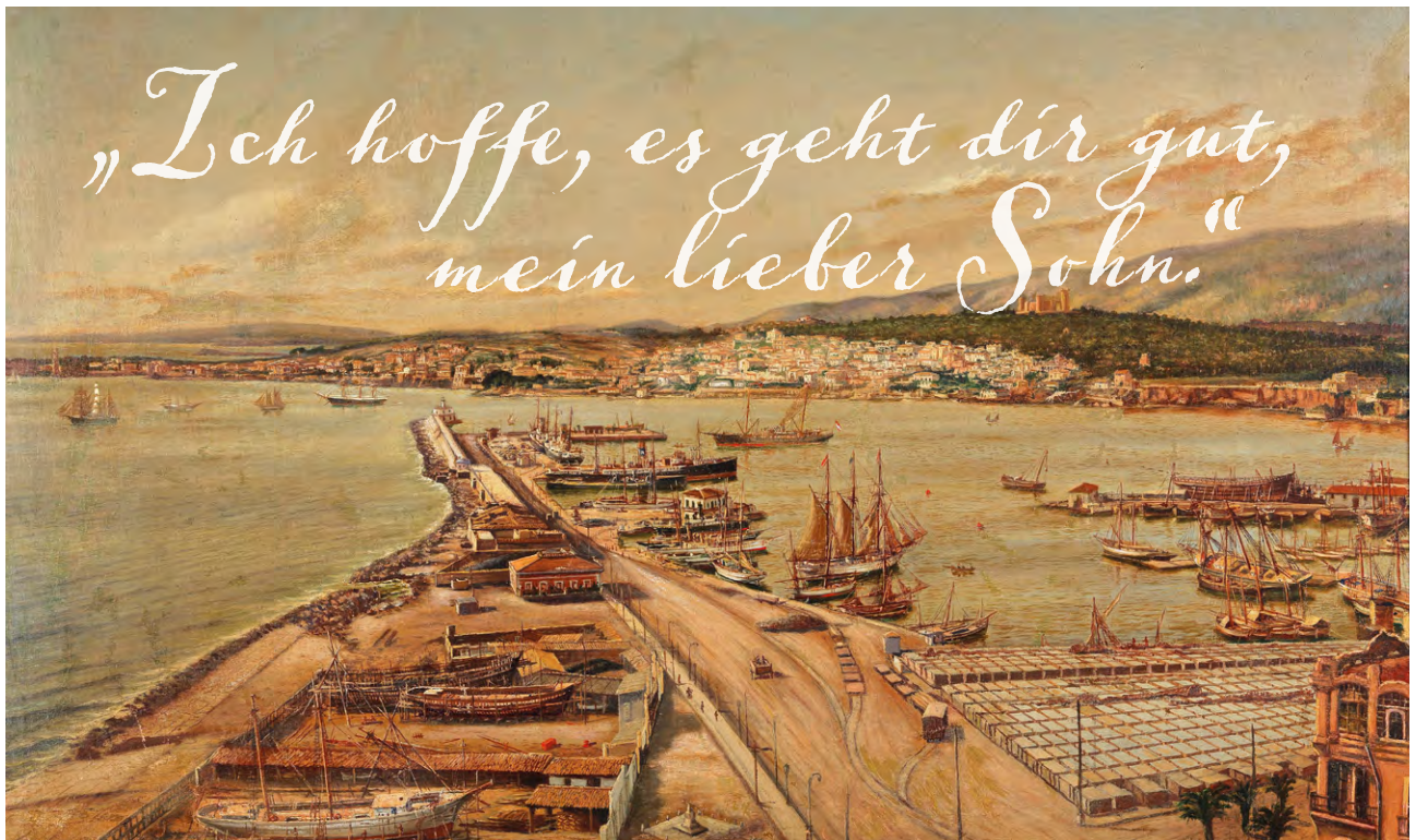
Blick über den Hafen von Triest um 1900.

Bora, Scirocco und Mistral – so heißen die drei Winde, die seit jeher durch Triest wirbeln. Im 19. Jahrhundert war die alte Hafenstadt an der Adria ein wichtiger Stützpunkt für die Postverbindungen europäischer Staaten nach Destinationen östlich von Suez. Post „via Triest“ in den Nahen oder Fernen Osten bietet ein Höchstmaß an „Abenteuer-Philatelie“. Jüngst wurde dem Haus Heinrich Köhler die vermutlich bedeutendste Sammlung internationaler Post anvertraut, die über die „Stadt der drei Winde“ lief – aufgebaut von dem renommierten Philatelisten Rolf Rohlf. Hier geben wir Ihnen erste Einblicke in diese einzigartige Kollektion der klassischen Kommunikationsgeschichte zwischen Okzident und Orient.