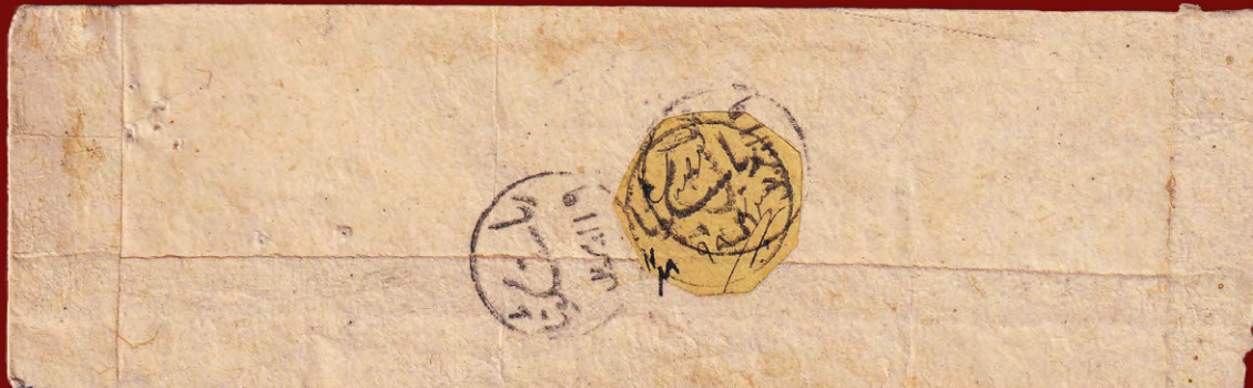
Einer von nur vier bekannten Briefen, die mit der 2 Paisa schwarz auf gelb des Feudalstaates Kotah frankiert wurden (Scott Nr. 2).