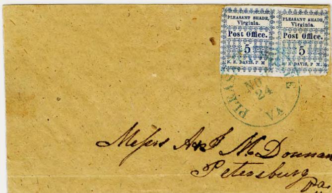
Das Pärchen der 5-Cents-Marke von Pleasant Shade in Virginia ist einzigartig. Auch dieser prominente Brief befand sich in den herausragenden Sammlungen von Arthur Hind und Alfred Caspary.

Lesen Sie dazu das Porträt auf den Seiten 10 bis 12 und erfahren Sie mehr über die topaktuelle Wiedervereinigung der beiden bedeutendsten Briefe dieser Ausgabe nach mehr als 40 Jahren.