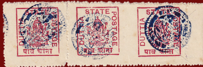
Dreierstreifen der ¼ Anna karmin von Duttia (1911). Die fehlende Perforation zwischen dem rechten Pärchen macht das Stück zur Spitzenrarität – bekannt sind nur vier mittig ungezähnte Paare dieser Ausgabe.